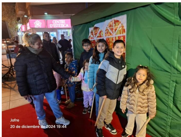
Participants 800 persones