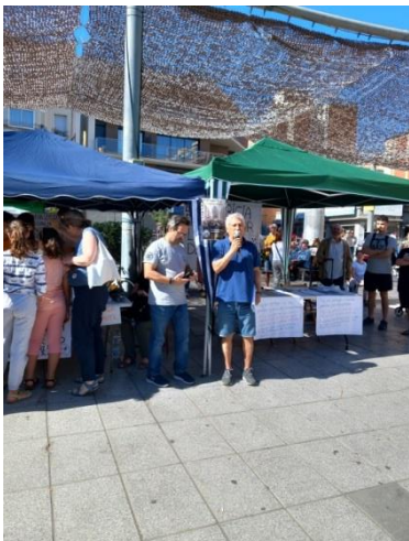
28 Setembre - Concentració Plaça del Mercat de Collblanc i lectura del manifest. Participants 500 persones