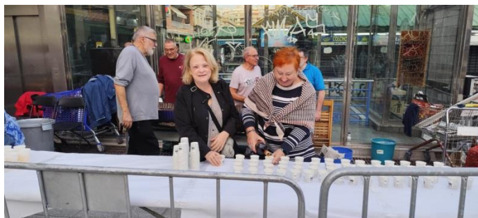
Participants 600 persones