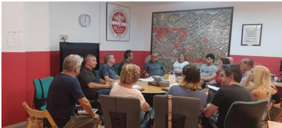
Primera reunió per constituir la Plataforma contra l'Especulació Immobiliària. Presentació 17/09/24